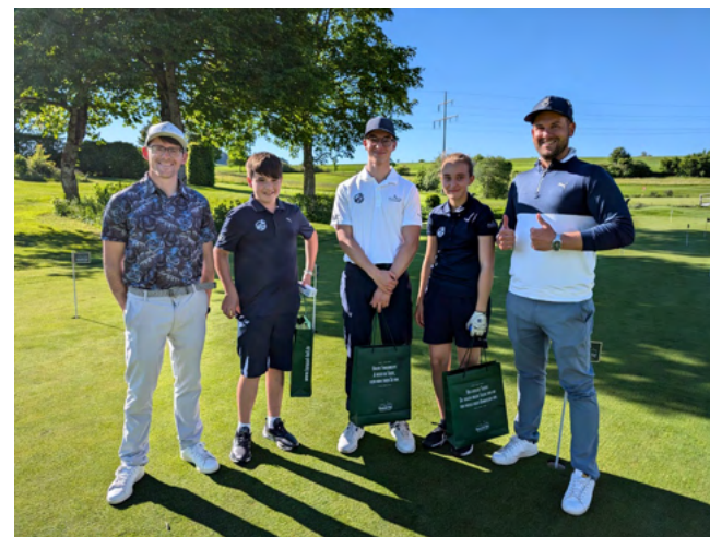
Abschluss-Challenges mit Siegerehrung